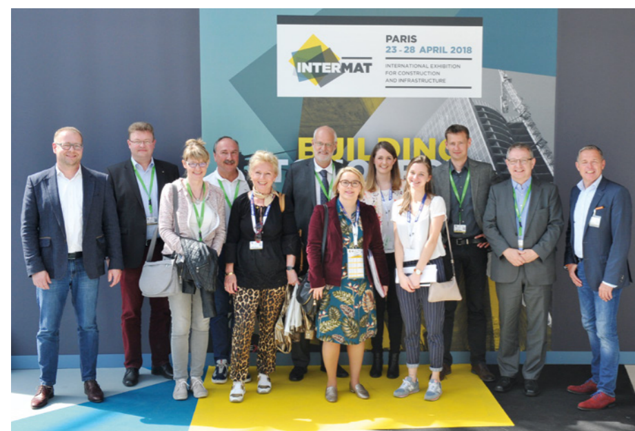
Die Delegationsmitglieder des Baumaschinen- und Geräteausschusses des ZDB informieren sich auf der Intermat in Paris über Trends in der Produktentwicklung.

Abschließend bot sich im Rahmen des Mesebesuchs die Gelegenheit, mit weiteren Herstellerverbänden aus Europa ins Gespräch zu kommen und die verbandlichen Aktivitäten abzustimmen. Die geführten Fachgespräche thematisierten dabei Fragen zu Dieselmotorenemissionen oder der Staubproblematik. Die nächste Ausgabe der Messe Intermat Paris findet 2021 statt. (do)