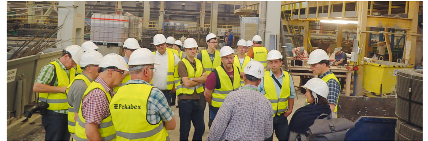
Bei zahlreichen Werksbesichtigungen konnten sich die Teilnehmer einen Eindruck von den Fertigungsprozessen polnischer Betonsteinhersteller verschaffen.

Vom 6. bis 10. Mai 2018 nahmen rund 20 Vertreter aus der Betonstein- und Terrazzoherstellerbranche an einer Studienreise nach Polen teil. Schwerpunkte waren die Besichtigung polnischer Hersteller und Werksführungen.